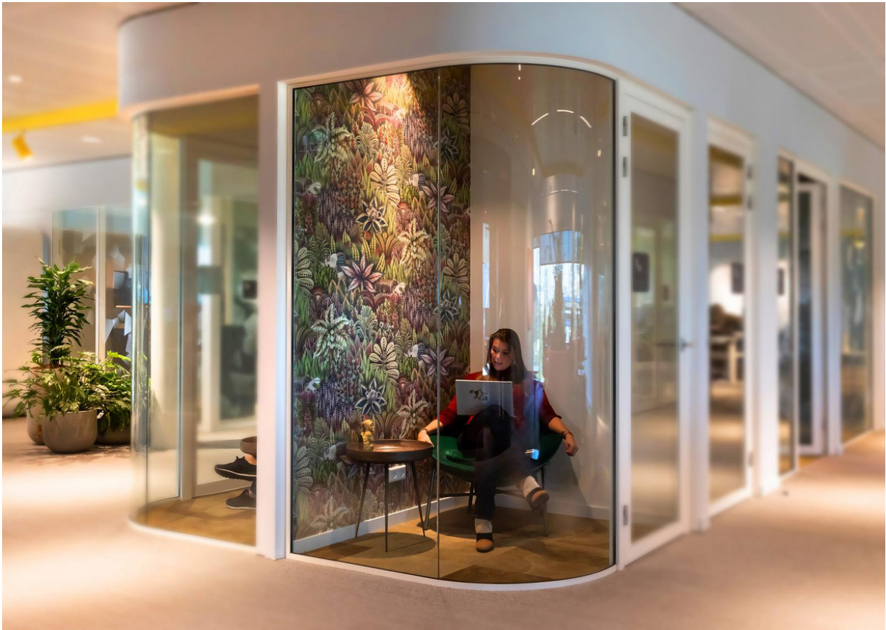
Beeld Tessa Jol

De ontwerpers werkten twee jaar aan die nieuwe filosofie en bijbehorende inrichting. "Microsoft wilde iets iconisch, eenzelfde grote stap als in 2008. Iets wat ook de partners en klanten van Microsoft inspireert. Wij vonden dat het een bescheidenheid moest uitstralen en niet de boodschap overschreeuwen. Een stille revolutie, geen knal."