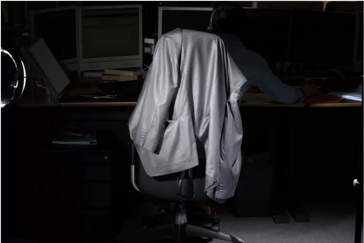
Beeld uit de fotoserie 'How Terry Likes His Coffee'.

Vooraf het aanhoren van andermans telefoongesprekken ervaart men als storend. Daarop wezen psychologen van de universiteit van San Diego in 2013 in het blad Plos One . De onderzoekers lieten 150 studenten woordspellen (anagrammen) oplossen terwijl er in de kamer ernaast een echt gesprek tussen twee mensen plaatsvond of een fictief telefoongesprek werd gevoerd door iemand die een script voorlas.