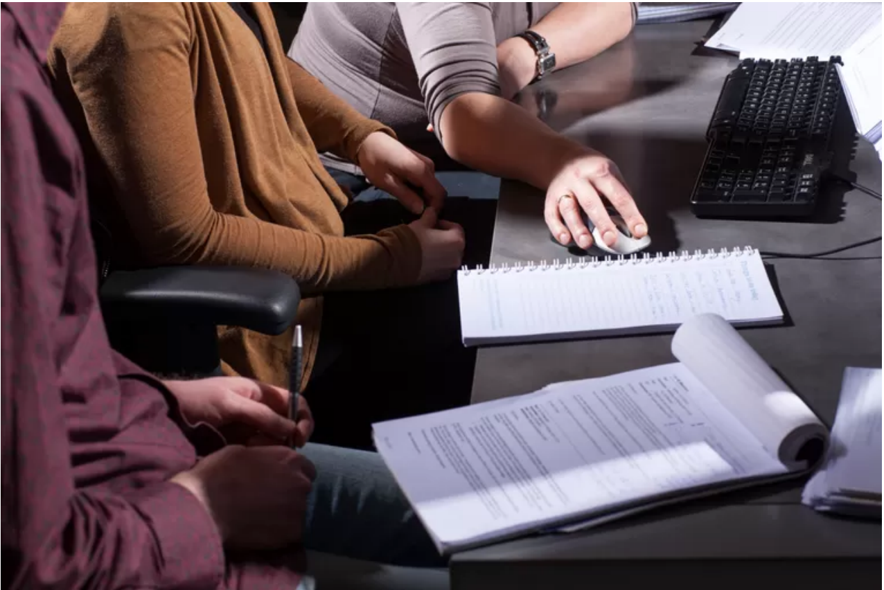
Beeld uit de fotoserie 'How Terry Likes His Coffee'.