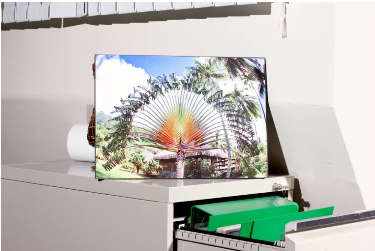
Beeld uit de fotoserie 'How Terry Likes His Coffee'.

Aan de overkant, een verdieping hoger, zien we werkplekken van amper tien vierkante meter die ruimte bieden aan twee promovendi. 'Die ruimtes waren oorspronkelijk bedoeld als flexplekken. Het formaat van die hokjes zou niet zo'n probleem zijn, was de gedachte. Je zou er toch geen uren achtereen in zitten. Maar in de praktijk gebeurt dat dus wel.'